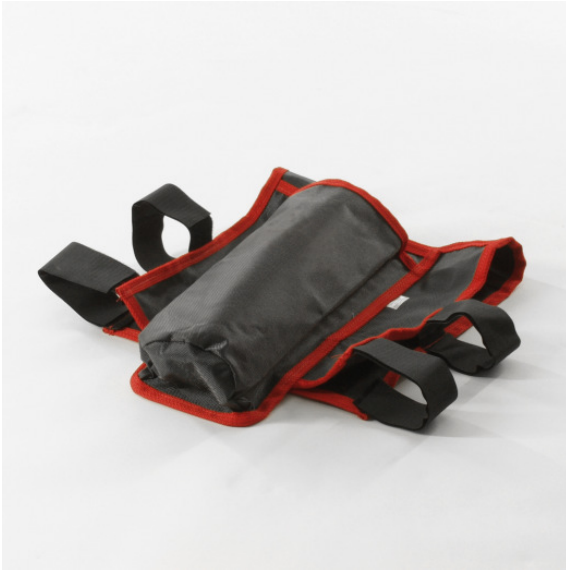
Rückenlehnen-Tasche für Sauerstoff