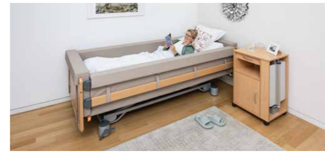
▲ Die durchgehende Polsterung bietet dem Bewohner optimalen Schutz für entspannende Ruhephasen.