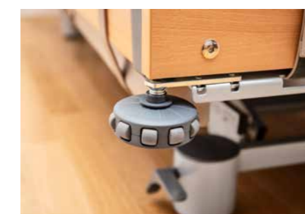
▲ Die optionale Wandabweisrolle verhindert Kollisionsschäden beim Fahren und der Höhenverstellung.