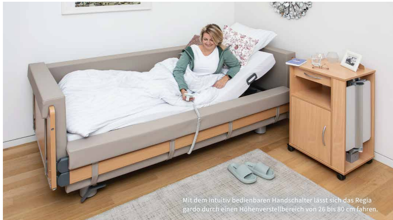
Mit dem intuitiv bedienbaren Handschalter lässt sich das Regia gardo durch einen Höhenverstellbereich von 26 bis 80 cm fahren.