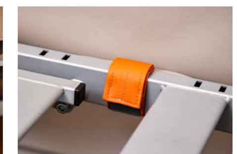
▲ Ein praktischer Klettverschluss sorgt dafür, dass zwischen den seitlichen Polstern und dem Bettrahmen kein Spalt entsteht.