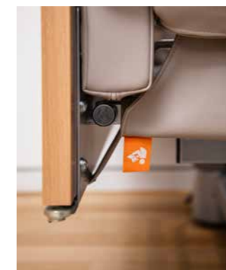
▲ Segufix-Verschlüsse halten die Enden der seitlichen Polster lückenlos am Bettrahmen.