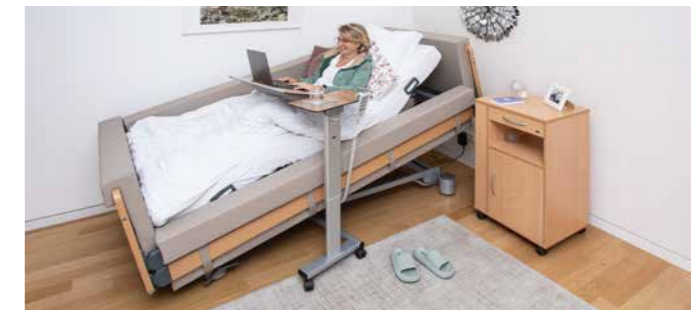
▲ In der Sitzposition können Bewohner im Bett essen, lesen oder einen Computer nutzen. Der wohnliche Beistelltisch Pleto ist dabei ein idealer Begleiter.