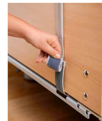
▲ Die Polster Teile lassen sich für eine gründliche Reinigung einfach abnehmen.