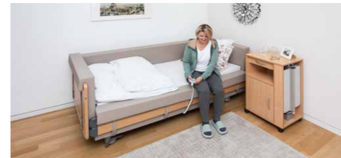
▲ Die seitliche Polsterung bewegt sich mit der durchgehenden Seitensicherung, sodass der Bewohner das Bett auf einer ergonomischen Höhe verlassen und dabei auf dem weichen Polster sitzen kann.