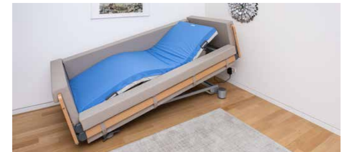
▲ Das Regia gardo wird serienmäßig mit einer Matratze geliefert, die sich den Verstellpositionen der Liegefläche flexibel anpasst.