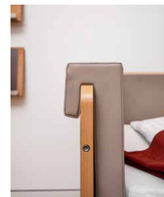
▲ Die Polster liegen dicht an den Betthauptern an – so entstehen keine unhygienischen Zwischenräume